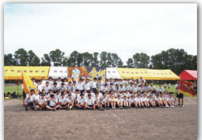
◇黄組優勝おめでとう◇